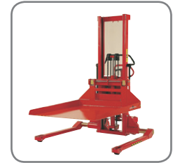
Opciones de anclaje rápido: brazo de grúa, porta-bobinas, plataforma, rotador de bobinas y volteador de bidones.