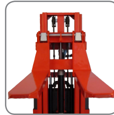
Con el sistema de anclaje rápido, el cambio entre las horquillas y los implementos opcionales resulta rápido y sencillo.