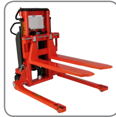
Las horquillas se pueden acoplar en todos los modelos Logiflex con tablero de eje pasador.

Horquillas finas: horquillas finas para casos de poca altura debajo de la carga que va a elevarse.