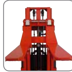
Con el sistema de anclaje rápido, el cambio entre las horquillas y los implementos opcionales resulta rápido y sencillo.