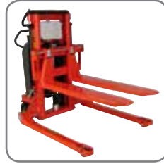
Las horquillas se pueden acoplar en todos los modelos Logiflex con tablero de eje pasador.

Horquillas finas: horquillas finas para casos de poca altura debajo de la carga que va a elevarse.