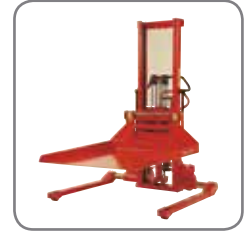
Opciones de anclaje rápido: brazo de grúa, porta-bobinas, plataforma, rotador de bobinas y volteador de bidones.