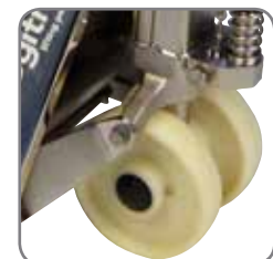
Rubbergesloten lagers in de wielen.

Vraag ons de specifieke details of bezoek www.logitrans.com Wij bieden eveneens op maat gemaakte oplossingen.