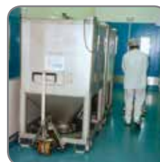
De Palletwagen in gebruik in de farmaceutische nijverheid.