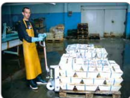
Inox - waar roestbestendigheid primeert.