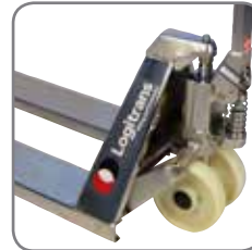
De laagste positie kan worden aangepast.