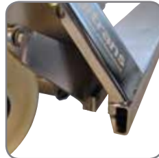
Volledig open of volledig gesloten palletwagen vergemakkelijkt efficiënt schoonmaken.