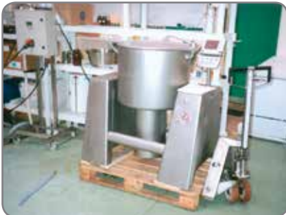
Inox Plus - voedings- en pharmaceutische industrie, waar hygiëne primeert.