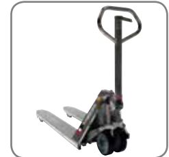
Panther Inox Plus is ook verkrijgbaar in explosievrij gekeurde uitvoering.