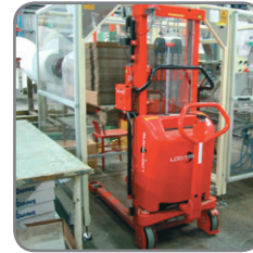
Zeer wendbaar : korte totale lengte, kleine draaicirkel, geleid sturen op de stuurwielen, laag eigengewicht.