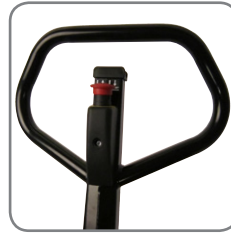
Ergonomisch handvat verzekert de gebruiker van een relaxte greep.

Sterke constructie verzekert een lange levensduur en lage onderhoudskosten. Verkrijgbaar in manueel en elektrisch heffen.