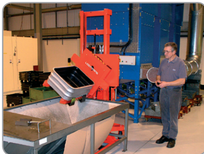
Verkrijgbaar met zijdelings kantelende vorken en / of andere optionele extra's zoals vatenkantelaar, kraanarm, speer.