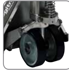
De toestellen worden voorzien van twee antistatische vulkolanwielen om statische electriciteit om te leiden.