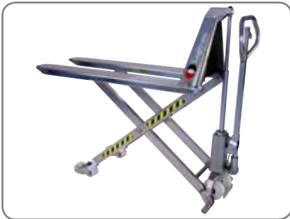
De standaard toestellen zijn manueel en gemaakt van roestvrij staal.

De explosievrije constructie wordt gekarakteriseerd door volgende productmarkering :