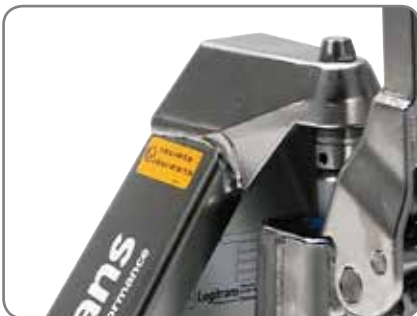
De explosievrije toestellen zijn bruikbaar voor de farmaceutische nijverheid, de olie-, gas- en verfindustrie.

II 2G Ex h IIB T6 Gb II 2D EX h IIB T85°C Db