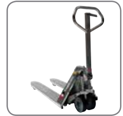
Sterke constructie garandeert een lange levensduur en lage onderhoudskosten.