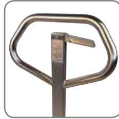
Ergonomisch handvat verzekert de gebruiker een relaxte greep.

De toestellen behoren in groep II en mogen werken in omgevingen geklasseerd als zone 1/zone 21 (omvat eveneens zone 2/zone 22). Dit wil zeggen daar waar occasioneel een explosieve atmosfeer gecreëerd wordt door gas en stof.