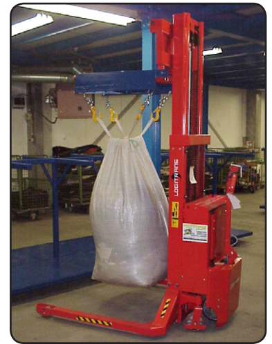
SEHSS die deel uitmaakt van een productielijn die tweedehands kleding sorteert. De kleding wordt gecontroleerd op schade en in grote witte zakken verpakt. 03174FC4