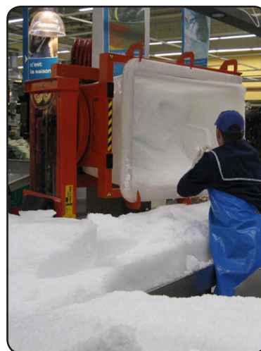
Een SELF met Rotator in een supermarkt om zeer vroeg in de ochtend ijs te storten op de visstand in de visafdeling. P05707-2