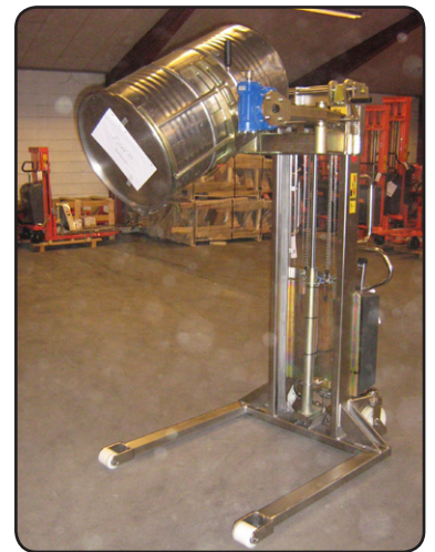
Roestvrije stapelaar met vatenkantelaar voor het heffen en ledigen van vaten. P06634