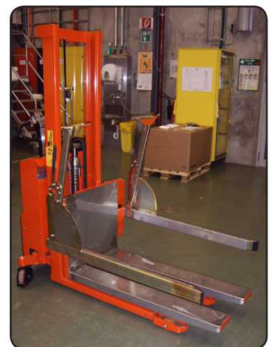
Rotator met inoxplaten voor transport van inox containers. Worden niet beschadigd en er kunnen geen verfschikjes in contact komen met de containers.