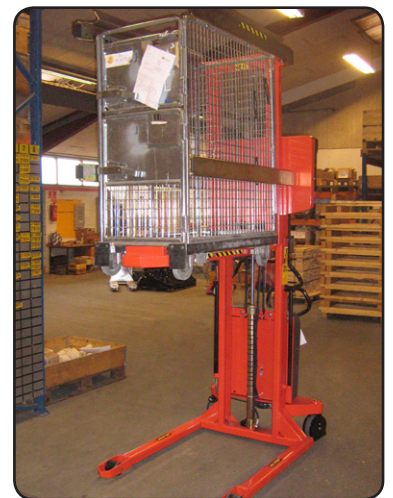
Logiflex ELF met Rotator in de Zweedse post om brievencontainers te ledigen op de sorteer-machine. P06473