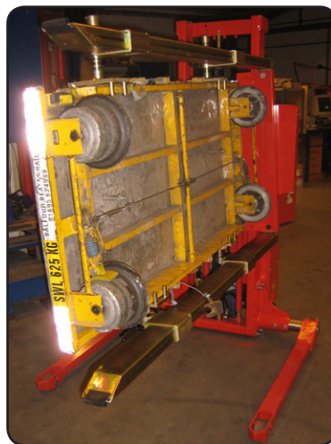
Logiflex spreidstandstapelaar met Rotator voor het keren van kleine spoorwagentjes voor onderhoud en reparatie. P06348-2