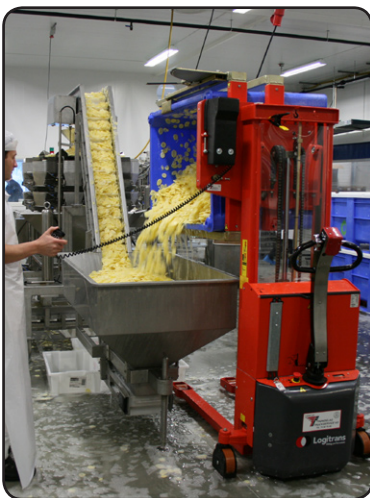
Elektrische rotator in gebruik bij Noors fabrikant van kant-en-klaar maaltijden voor catering en winkels.