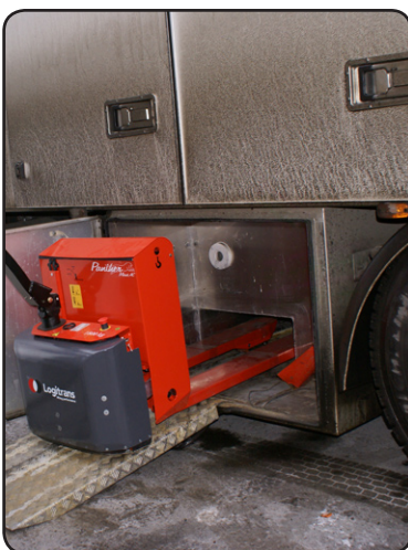
Een speciaal lage constructie om de Panther Maxi op te bergen onder de vrachtwagen tijdens het transport. Dit geeft plaats aan twee extra paletten in de vrachtwagen. P04354