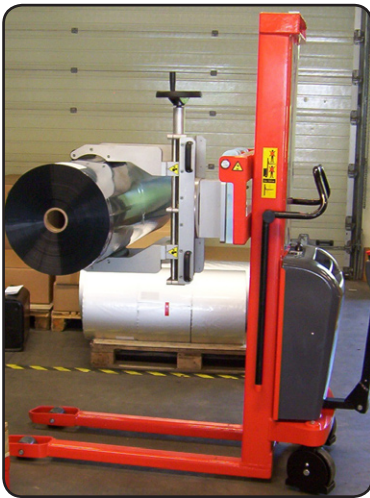
Speciale rollenklem voor gladde, 200 kg wegende rollen antimagnetische folie voor elektronische componenten. P08025

Alleen de wetten der natuur en veiligheidsredenen kunnen ons limiteren !