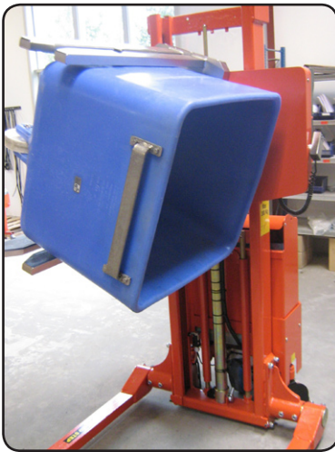
SELF met rotator voor het keren van Vemag containers. Wordt gebruikt in een marsepeinfabriek in Denemarken. P06692

aan de toepassing van de klant. Onze toestellen op maat zijn ontwikkeld op basis van ons flexibel gamma zonder dat de veiligheid in gedrang komt.