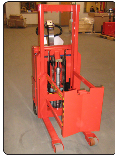
SELF Maxi met speciale drum lifter. Een van de handvaten van het vat wordt gebruikt om het vat vast te maken. P07267-2