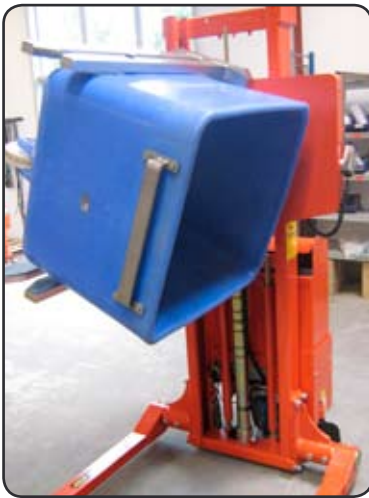
SELF met rotator voor het keren van Vemag containers. Wordt gebruikt in een marsepeinfabriek in Denemarken. P06692

aan de toepassing van de klant. Onze toestellen op maat zijn ontwikkeld op basis van ons flexibel gamma zonder dat de veiligheid in gedrang komt.