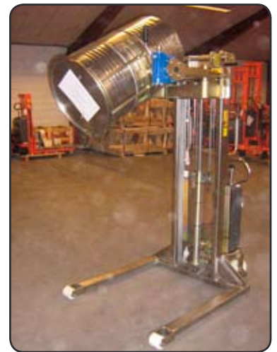
Roestvrije stapelaar met vatenkantelaar voor het heffen en ledigen van vaten. P06634