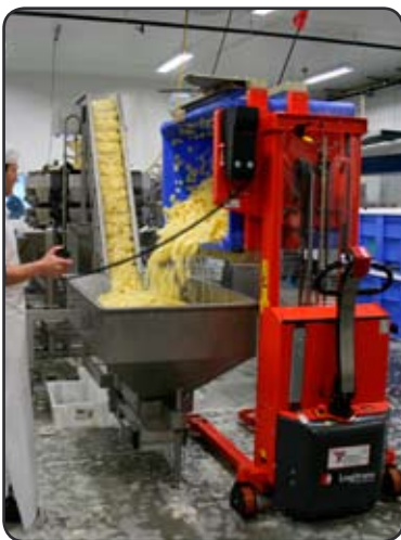
Elektrische rotator in gebruik bij Noors fabrikant van kant-en-klaar maaltijden voor catering en winkels.