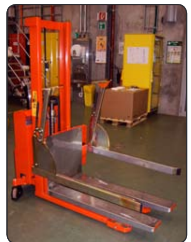
Rotator met inoxplaten voor transport van inox containers. Worden niet beschadigd en er kunnen geen verfoeltes in contact komen met de containers.