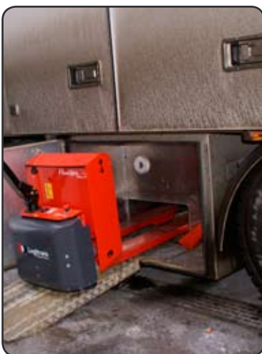
Een speciaal lage constructie om de Panther Maxi op te bergen onder de vrachtwagen tijdens het transport. Dit geeft plaats aan twee extra paletten in de vrachtwagen. P04354