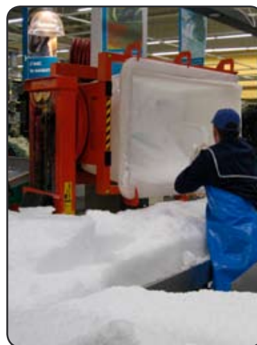
Een SELF met Rotator in een supermarkt om zeer vroeg in de ochtend ijs te storten op de visstand in de visafdeling. P05707-2