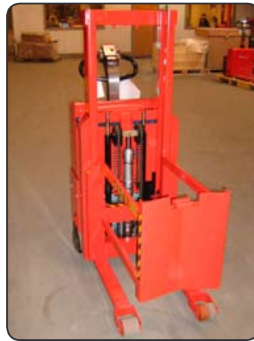
SELF Maxi met speciale drum lifter. Een van de handvaten van het vat wordt gebruikt om het vat vast te maken. P07267-2