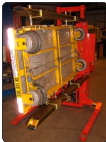
Logiflex spreidstandstapelaar met Rotator voor het keren van kleine spoorwagentjes voor onderhoud en reparatie. P06348-2