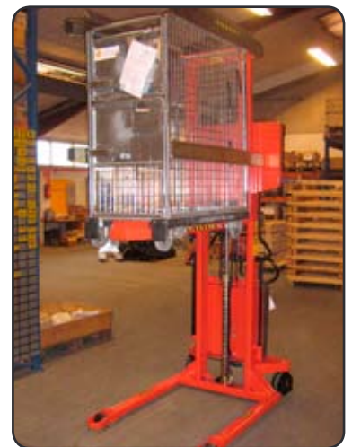
Logiflex ELF met Rotator in de Zweedse post om brievencontainers te ledigen op de sorteer-machine. P06473