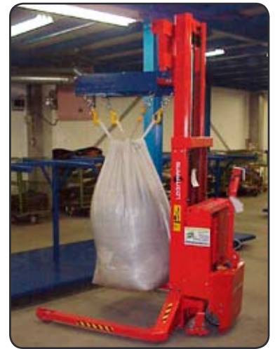
SEHSS die deel uitmaakt van een productielijn die tweedehands kleding sorteert. De kleding wordt gecontroleerd op schade en in grote witte zakken verpakt. 03174FC4