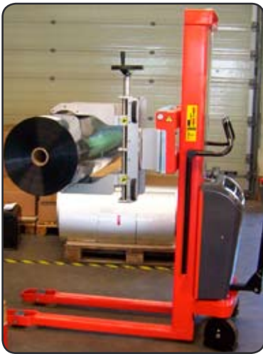
Speciale rollenklem voor gladde, 200 kg wegende rollen antimagnetische folie voor elektronische componenten. P08025

Alleen de wetten der natuur en veiligheidsredenen kunnen ons limiteren !