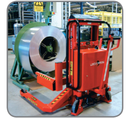
Logiflex met vaste vatenvorken om zware rollen met grote diameter te verplaatsen.