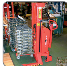
Logiflex met zeer korte vorken voor het behandelen van elektrische kasten.