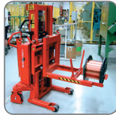
Logiflex met zijdelings instelbaar vorkenbord. De rol wordt op de speer van de machine geplaatst.

Na het ontvangen van de aanvraag, met een duidelijke beschrijving van de toepassing, zal Logitrans een offerte opmaken. Bij het ontvangen van uw bestelling, en indien vereist, zal Logitrans een tekening uitwerken die zal moeten goedgekeurd worden voor de productie start.