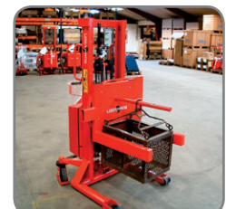
Logiflex met zijdelings kantelende vorken en speer om box te kantelen.

Vraag meer informatie of bezoek www.logitrans.com