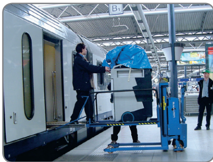
Logiflex met ramp om karren in en uit de trein te rijden.