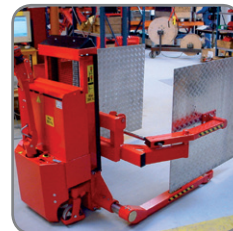
Spreidstand Logiflex met speciale grijparmen voor lichte materialen.