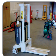
Logitrans productengamma kan geleverd worden in alle RAL kleuren.