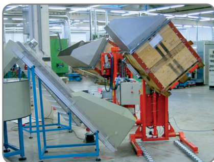
Logiflex met zijdelings kantelende vorken voor het heffen en ledigen van onderdelen in een productielijn.