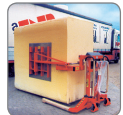
Spreidstand Logiflex met speciale grijparmen voor schuimrubberen blokken.