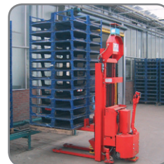
Elektrische Logiflex op afstand bediend door de computer, brengt lege paletten naar productielijn.