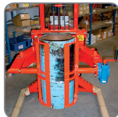
Logiflex met speciale vatenkantelaar.