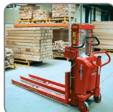
Logiflex met 3 extra lange vorken voor lange en zware lading.